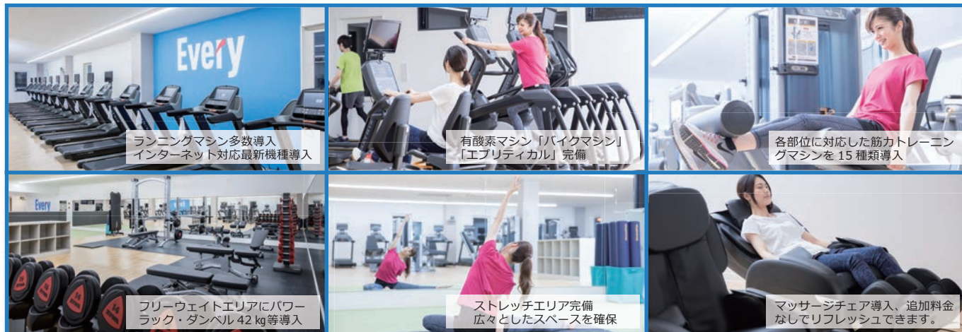
ランニングマシン多数導入 インターネット対応最新機種導入