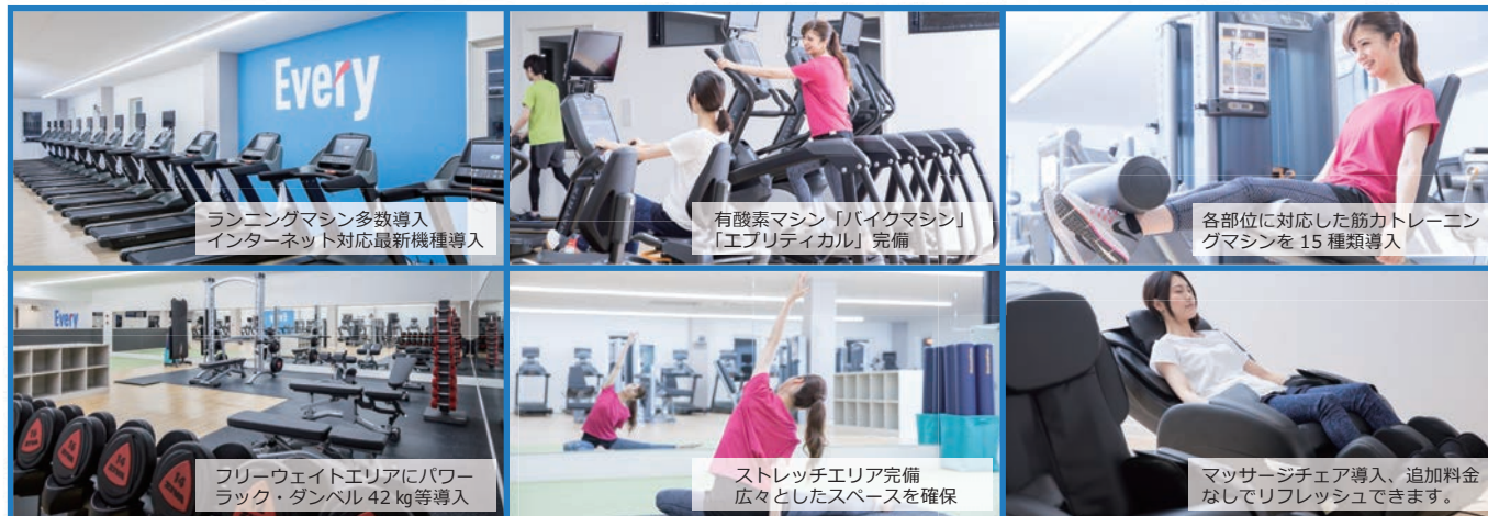
ランニングマシン多数導入 インターネット対応最新機種導入